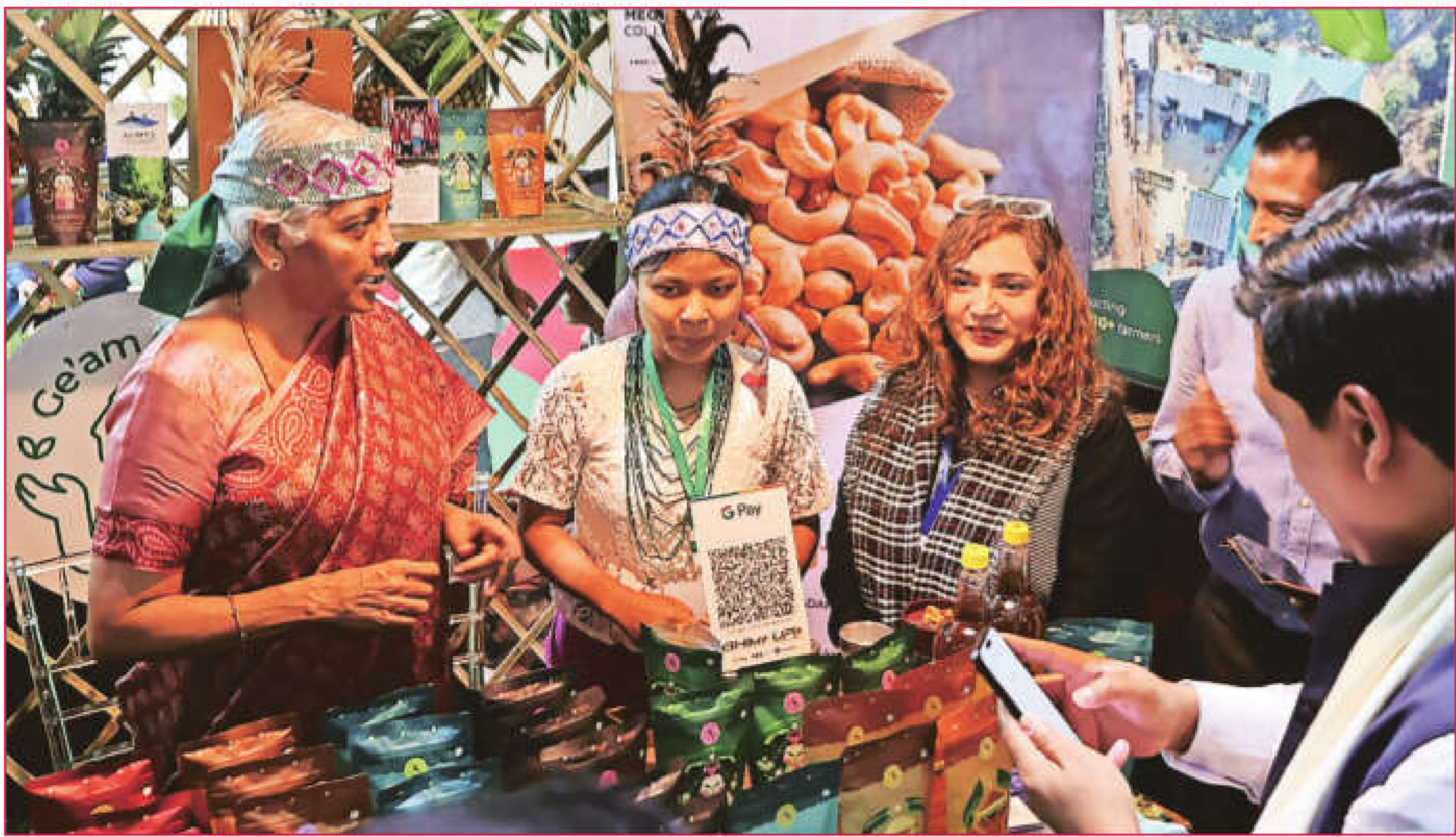
Nirmala Sitharamam speaks with participants at an interactive session in Shillong on Saturday. The Union finance minister during her visit to the state underscored the need to balance ecological preservation with the aspirations of development, particularly in regions like Meghalaya